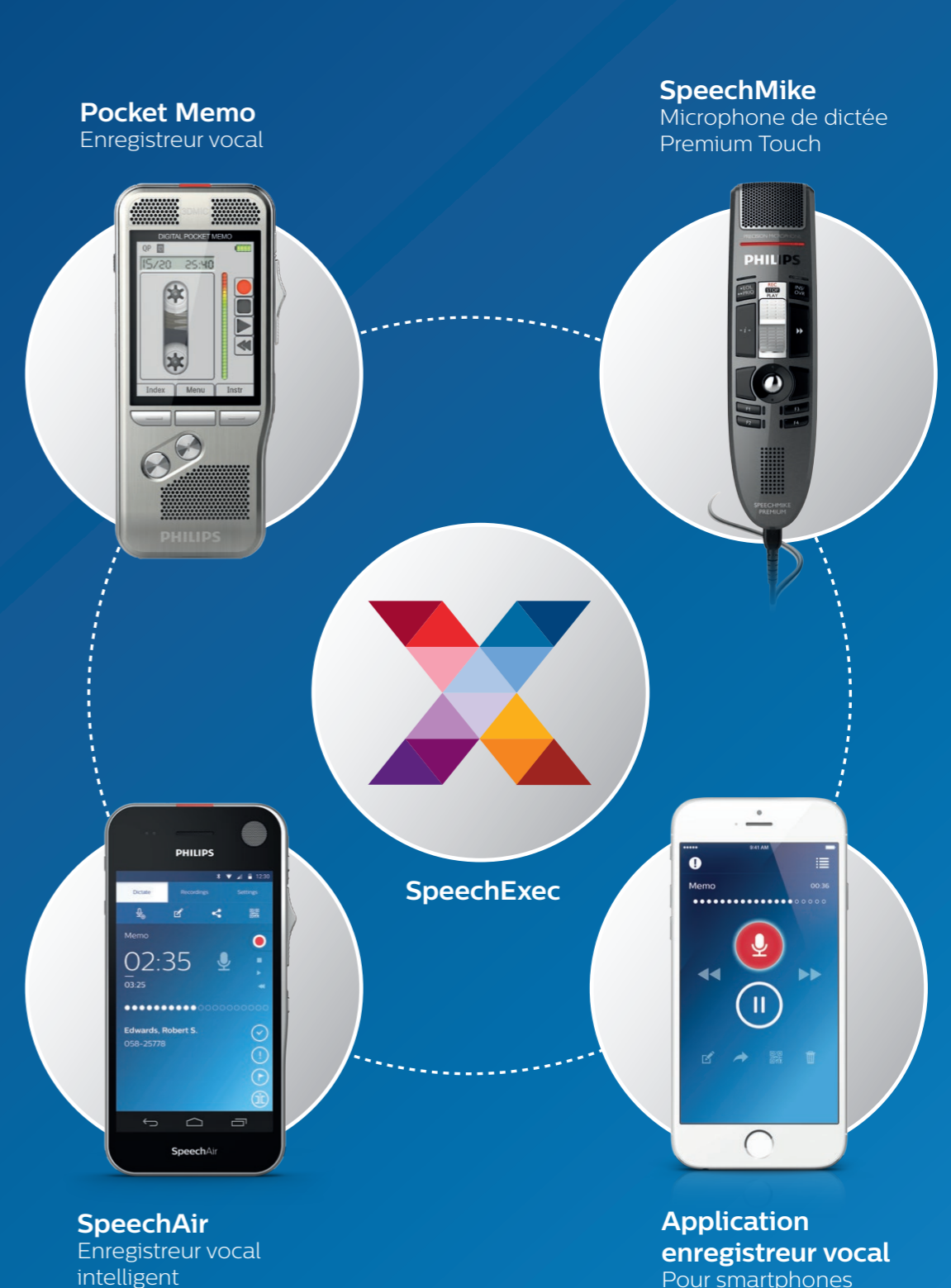
SpeechAir Enregistreur vocal intelligent

Compatible avec tous les enregistreurs Philips